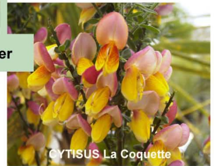
CYTISUS La Coquette