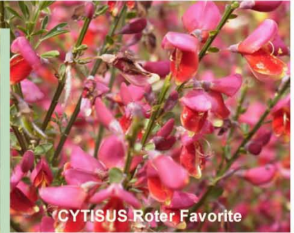
CYTISUS Roter Favorite