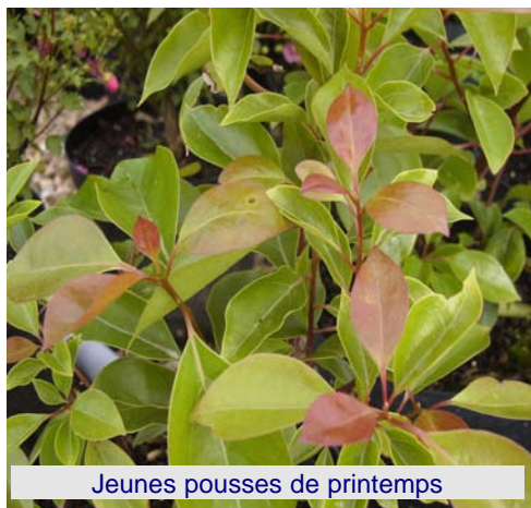
Jeunes pousses de printemps

Une taille de formation peut être effectuée en début de printemps, également pour diminuer l'encombrement de la plante si nécessaire.