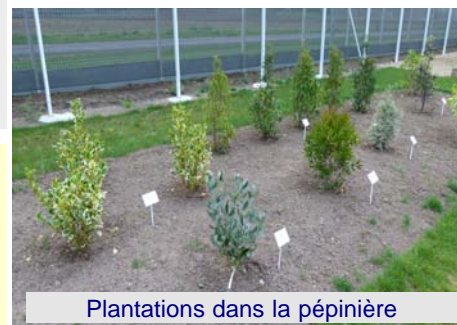
Plantations dans la pépinière

Réclame un terrain fertile et bien drainé, et à utiliser en petit arbre isolé sur une pelouse, ou en grand arbuste de haie variée. Supporte à merveille la culture en bacs et jardinières, si il est rempoté régulièrement.