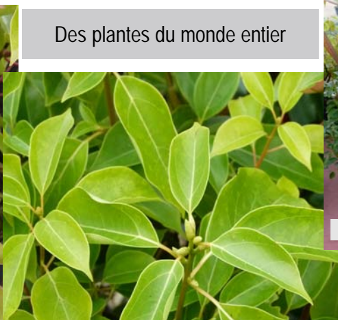
Feuillage de printemps