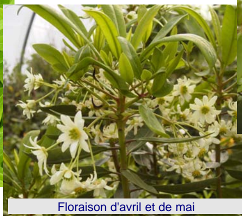
Floraison d'avril et de mai