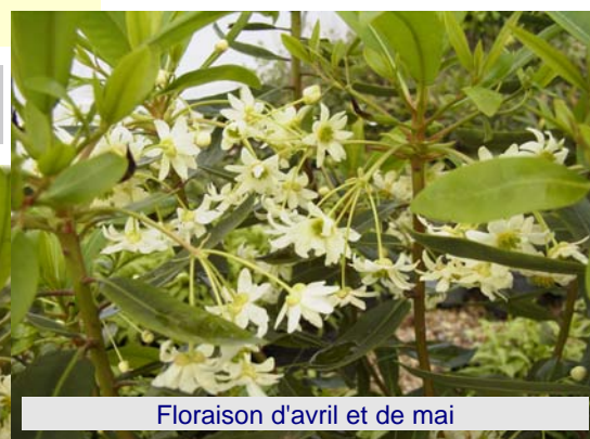
Floraison d'avril et de mai