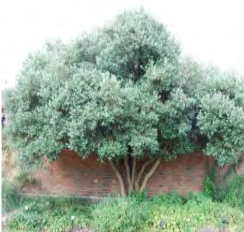
Arbre bien développé