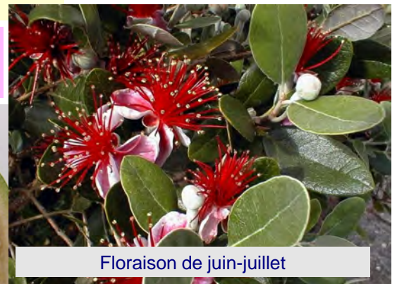
Floraison de juin-juillet