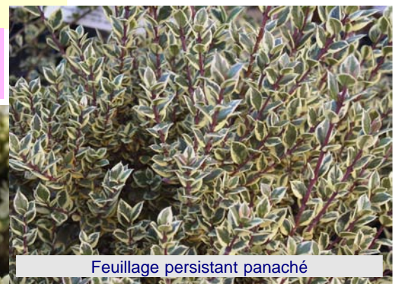
Feuillage persistant panaché