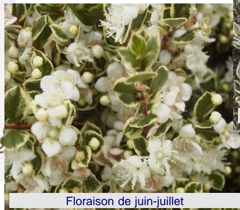
Floraison de juin-juillet