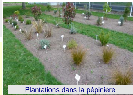
Plantations dans la pépinière