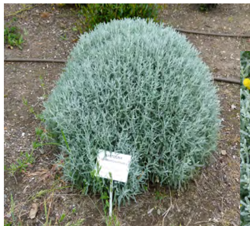
Spécimen bien formé en dôme