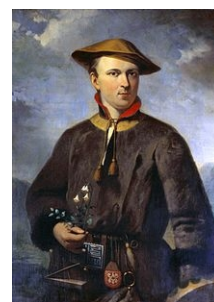
Carl von Linné

Dédié à Escallon, disciple du botaniste Linné Fils, qui était un voyageur espagnol et découvrit la première espèce d'Escallonia en Amérique du Sud, au début du XIXème siècle.