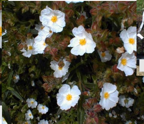
Floraison de juin