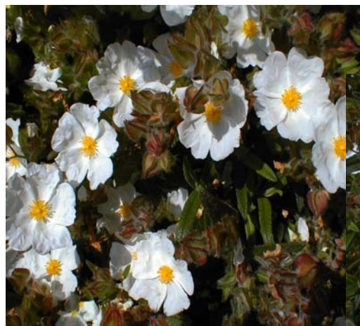
Floraison de juin