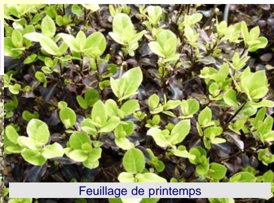
Feuillage de printemps