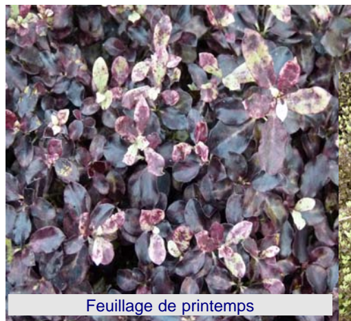
Feuillage de printemps