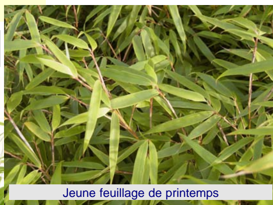
Jeune feuillage de printemps